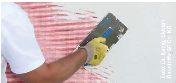
Bild 5: Vollflächiges Einbetten des Armierungsgewebes in einen Armierungsmörtel

Oberflächen mit Hellbezugswerten unter 20 sollten nur in Ausnahmefällen ausgeführt werden. Weitere Informationen enthalten die Merkblätter [3, 4].