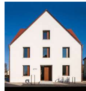
Bild 4: Verputztes Ziegelhaus Architekt: Michael Feil

„schwarz“, 100 entspricht „weiß“) als auch bei der Ausführung von feinkörnigen Oberputzen mit einer Korngröße kleiner 2 mm sowie bei gefilzten Oberputzen sind Zusatzmaßnahmen, wie z. B. ein Armierungsputz mit Gewebeeinlage, vorzusehen, die gesondert im Leistungsverzeichnis zu berücksichtigen sind.